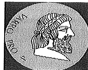
Liceo Ginnasio "Marco Terenzio Varrone"

Ministero dell'Istruzione Ufficio Scolastico Regionale Per il Lazio ISTITUTO DI ISTRUZIONE SUPERIORE "CARLO JUCCI"