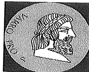
Liceo Ginnasio "Marco Terenzio Varrone"

Ministero dell'Istruzione Ufficio Scolastico Regionale Per il Lazio ISTITUTO DI ISTRUZIONE SUPERIORE "CARLO JUCCI"